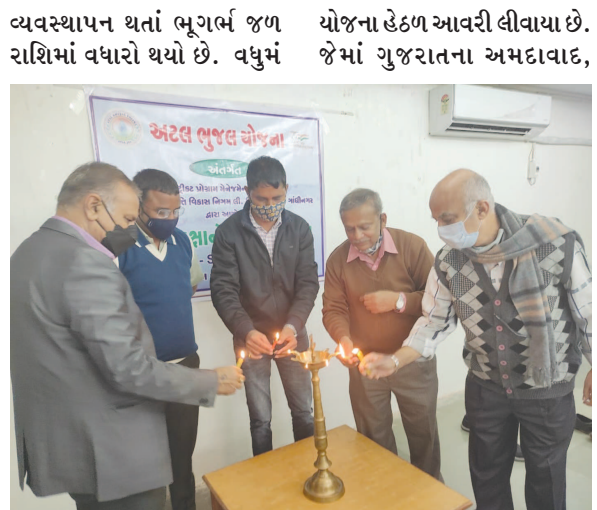
તેમણે જણાવ્યું હતું કે, દેશના સાત રાજ્યોના ૭૮ જિલ્લાઓના ૧૯૩ તાલુકાઓને અટલ જળ ગાંધીનગર, મહેસાણા, સાબરકાંઠા, બનાસકાંઠા, પાટણ અને કચ્છ એમ સાત જિલ્લાના