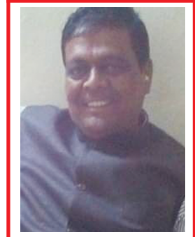
ગીરીશભાઈ કોદરભાઈ પટેલ સ્વામિનારાયણ સોસાયટી વિભાગ-૨ બાયડ (ગાબર)