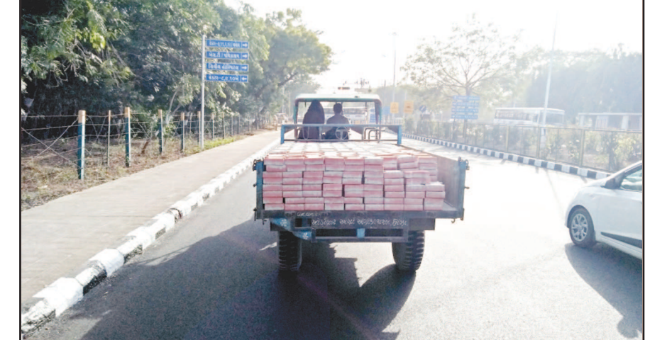
વાયઘાન્ટ સમિતિ માટે આ વખતે જોરદાર તૈયારીઓ કરાઈ હતી. શહેરને ખુબ શાહગર્ભુ હવે પરંતુ વાયઘાન્ટ સમિતિ દ્વારા મહાત્મા મંદિર પાસે નાંખવામાં આવેલા પેવર ઠલોકને હવે હટાવી લેવાયા છે. ટ્રેક્ટરો ભરીને પેવર ઠલોકને લઈ જવાઈ રહ્યા છે.

રક્તદાન શિબિર"માં રક્તદાન કરનાર રક્તદાતાઓને સર્ટીફિકેટ તથા આકર્ષક શુભેચ્છા ભેટ આપી સન્માનવામાં આવશે. આ રક્તદાન શિબિરમાં વધુમાં વધુ યુવાનોએ જોડાઈ પ્રજાસત્તાક પર્વના શુભ દિને રાષ્ટ્રસેવાના ભાગરૂપે શક્ય હોય તેટલા વધુ યુનિટ રક્તદાન કરવા તેમજ કરાવવા આયોજકો દ્વારા જાહેર અનુરોધ કરવામાં આવ્યો છે.