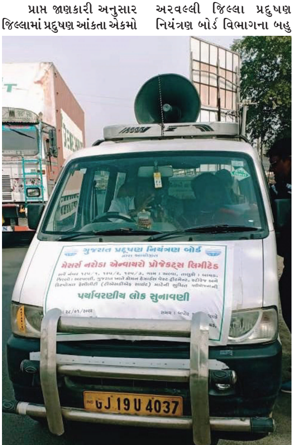
પાસેથી પગલાં ભરનારં એકમ જ પૈસા ખંખેરીને પાછલા બારણે ઢીલી નીતિ અપનાવતા હોવાના આરોપ લાગેલા છે. સાબરકાંઠા-પંકાચેલા અધિકારીઓએ પ્રજા પ્રદુષણમાંથી બહાર આવે તેવા એકેય પગલાં ભર્યાં નથી અને માત્ર નોટીસો ફટકારી કામગીરી કરી રહ્યાના દેખાડા કર્યા છે.

બાયડ તા.૨૪ બાયડ તાલુકાના અલવા ગામના સીમાડાના સર્વે નં.૧૨૫/૧/૨/૩ માં સૂચિત ઝેરી કેમિકલ ડમ્પીંગ સાઈટને મંજુરી આપવા માટે આગામી તા.૨૮ જાન્યુઆરીએ પર્યાવરણીય લોકસુનાવણીનું બપોરે ૧૨ વાગે સૂચિત સ્થળે યોજવાની છે ત્યારે આ વિસ્તારના ખેડૂતોએ ઝેરી કચરાની ડમ્પીંગ સાઈટ શરૂ કરવા નહિ દઈએ તેવો ટંકાર કરી બલિદાન આપશું પરંતુ અમારી જમીન અને માનવસૃષ્ટિને બરબાદ થવા નહિ દઈએ તેમ જણાવ્યું છે. જ્યારે આંદોલનમાં ફૂટી પડનારા તકસાધુઓને અમે અંદરખાને ઓળખ્યા છે તેવું કેટલાંક ખેડૂતોએ જણાવ્યું છે. આગામી શનિવાર ગુજરાત પ્રદુષણ નિયંત્રણ બોર્ડ અને વહિવટીતંત્ર માટે એક્સિડેન્ટ સમાન બની રહેશે. જ્યારે કોરોનાના કારણે ઝાલિયાઓથી વધુ લોકોના ભેગા થવા ઉપર પ્રતિબંધ હોવા છતાં પર્યાવરણીય લોકસુનાવણી મુલતવી રાખવાના બદલે યોજવા માટે પ્રદુષણ નિયંત્રણ બોર્ડ કેમ અધિરં બન્યું છે તેની સમજ પ્રજામાં આવી ગઈ છે. અંદરખાને મોટાપાયે ભ્રષ્ટાચારની આશંકા પણ વ્યક્ત થઈ રહી છે.