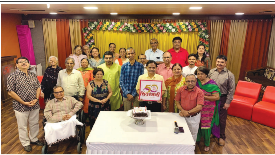
શિવરજની, ગાંધીનગરના સુવર્ણ જયંતિ વર્ષ અનુસંધાને સંસ્થાના ૫૧મા જન્મદિન નિમિત્તે એક નાનકડા ગેટ ટુ ગેટનું આયોજન કરવામાં આવ્યું હતું જેમાં મહાનુભાવો ઉપસ્થિત રહી સંસ્થાન શુભકામનાઓ પાઠવી હતી.