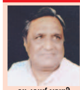
ભાનુભાઈ પુરાણી પ્રમુખ, મિલ અને ગાંધી મિત્ર વર્તુળ