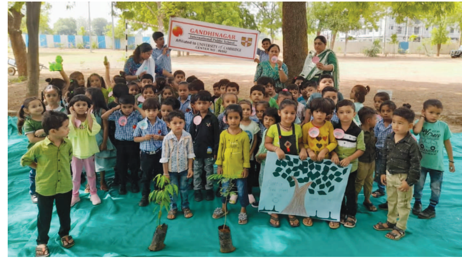
ગાંધીનગર ઇન્ટરનેશનલ પબ્લિક સ્કૂલ, રાંધેજા ખાતે પ્રિ-પ્રાયમરી વિભાગમાં વિવિધ પ્રવૃત્તિઓનું આયોજન કરવામાં આવ્યું હતું. જેમાં પર્યાવરણ વિશેની જાગૃતિ, યોગદિવસ અને વૃક્ષારોપણની પ્રવૃત્તિઓ કરવામાં આવી હતી. જેમાં નાનાં ભૂલકાઓએ આનંદ-ઉલ્લાસથી ભાગ લીધો હતો.