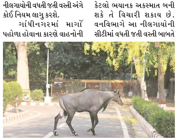
સ્પીડ વધુ હોય છે અને વાહનચાલકો ઓવરસ્પીડમાં જતા અચાનક નીલગાય આડી આવતા ચોકકસ નિર્ણય લેવો જ રહ્યો. વનરાજીની વચ્ચે વિકસેલા પાટનગર ગાંધીનગરમાં પહેલેથી જ

નીલગાયોની વધતી જતી વસ્તી અંગે કોઈ નિયમ લાગુ કરશે. ગાંધીનગરમાં માર્ગો પહોળા હોવાના કારણે વાહનોની કેટલો ભયાનક અકસ્માત બની શકે તે વિચારી શકાય છે. વનવિભાગે આ નીલગાયોની સીટીમાં વધતી જતી વસ્તી બાબતે પશુ પક્ષીઓની સંખ્યા વધુ હતી ત્યારે માનવવસ્તી વધવાને કારણે આ જંગલી પશુ પક્ષીઓ ગાંધીનગર શહેરની આસપાસ આવેલા જંગલ વિસ્તારમાં જતા રહ્યા હતા અને અહીં તેમને ખોરાક મળી રહેવાને કારણે ઘણા પશુ પક્ષીઓએ અહીં જ વસવાટ કરી લીધો હતો. પરંતુ છેલ્લા ઘણા વખતથી નીલગાય અને વાંદરાની વસ્તી વધી રહી છે.