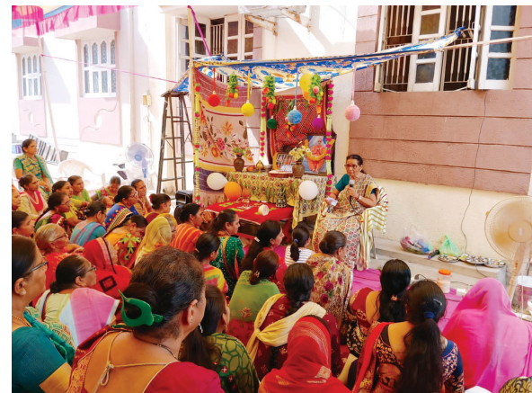
કથા નિરૂપણ થયા હતા. દરેક મંડળમાં ખૂબ મોટી સંખ્યામાં બહેનોએ ઉપસ્થિત રહી શ્રીજી મહારાજ સહિત ગુણાતીત પરંપરાના ચરણે ભક્તિ અર્થ અર્પણ કર્યું હતું.

ગાંધીનગર, તા.૩ બીએપીએસ સંસ્થાના ગાંધીનગર ક્ષેત્ર -૧ના મંડળો દ્વારા ઉજવાયેલ મહિલા પારાયણમાં આયોજનમાં આ વર્ષે અનેરો આનંદ-ઉત્સાહ સાથે ભક્તિભાવ છલકાવ્યો જોવા મળ્યો હતો. પ્રમુખસ્વામી શતાબ્દી નિમિત્તે દરેક મંડળે સુંદર પોથીયાત્રા કાઢી હતી. હરિભક્તોના ઘેર પોથી પધરામણી થઈ હતી. શતાબ્દી નિમિત્તે ઉજવાઈ રહેલા આ વર્ષે પારાયણની શરૂઆતમાં મહાપૂજા કરાઈ હતી. પ્રમુખસ્વામીના એકતા, મહિમા અને સેવા જેવા ગુણો વિષયક ગુણાતીત પરંપરાના ચરણે ભક્તિ અર્થ અર્પણ કર્યું હતું.