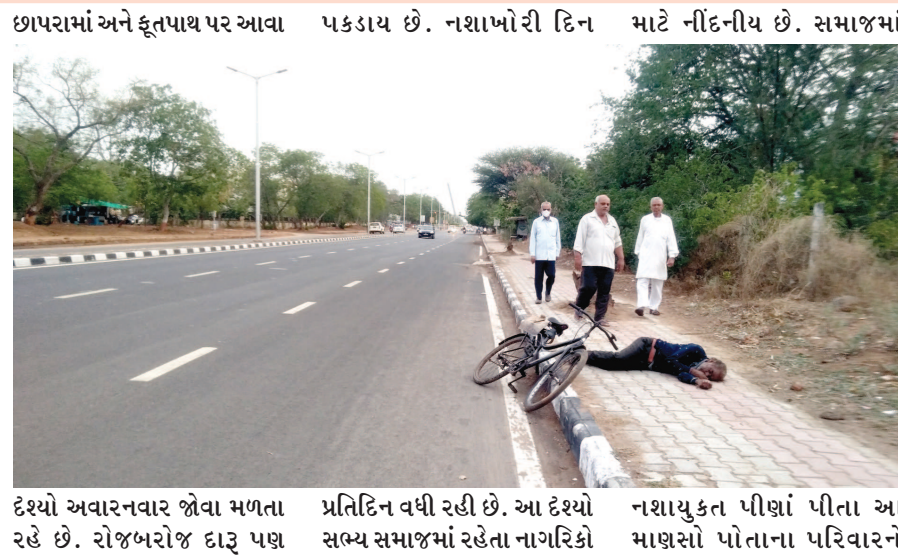
દેશ્યો અવારનવાર જોવા મળતા રહે છે. રોજબરોજ દારૂ પછ પ્રતિદિન વધી રહી છે. આ દેશ્યો નશાયુક્ત પીણાં પીતા આ માણસો પોતાના પરિવારને

ગાંધીનગર, તા.૩ ગાંધીનગરને શિક્ષણની નગરી તરીકે ઓળખવામાં આવે છે જ્યાં શિક્ષિત માણસોનું પ્રમાણ પણ વધારે છે ત્યારે આ શિક્ષિત સમાજની સાથે સાથે એક એવો સમાજ પણ છે જે મજૂરી કરીને પોતાનું ગુજરાન ચલાવે છે. નાના નાના વેપાર ધંધા કરીને પોતાના પરિવારનું ગુજરાન ચલાવે છે. આવા પરિવારોમાંથી કેટલાક માણસો જે કમાણી કરે છે તે નશાખોરીમાં વેડફીને જીવન બરબાદ કરવા તરફ વળી રહ્યા છે. જેઓ પોતાના સંતાનો કે પરિવારનો વિચાર સુધ્ધા કર્યા નગર નશાખોરીના રવાડે જોવા મળે છે.