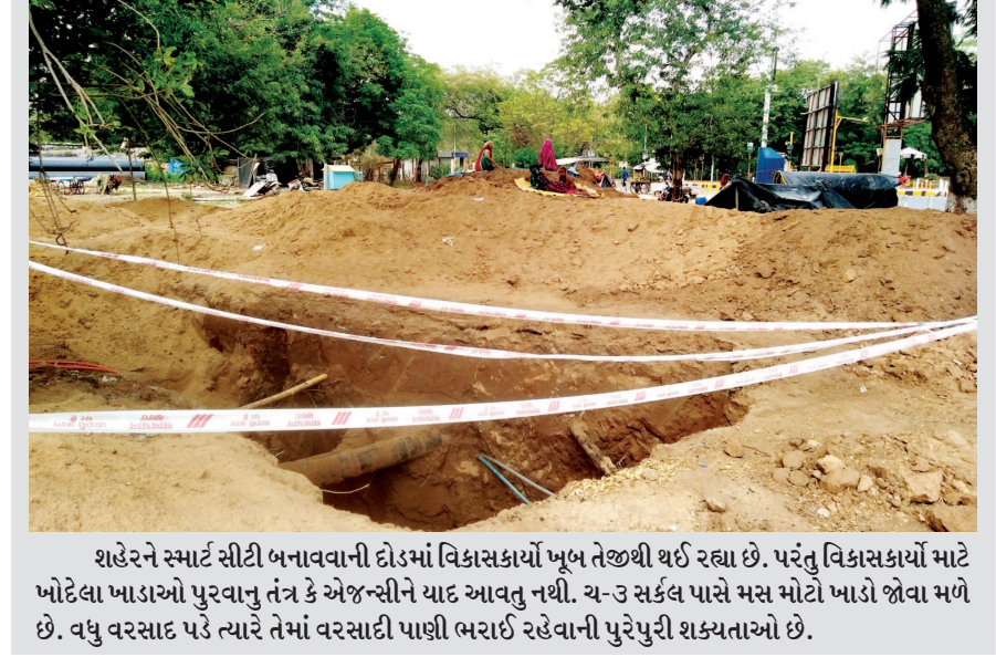
શહેરને સ્માર્ટ સીટી બનાવવાની દોડમાં વિકાસકાર્યો ખૂબ તેજથી થઈ રહ્યા છે. પરંતુ વિકાસકાર્યો માટે ખોદેલા ખાડાઓ પુરવાનું તંત્ર કે એજન્સીને યાદ આવતુ નથી. ચ-૩ સર્કલ પાસે મસ મોટો ખાડો જોવા મળે છે. વધુ વરસાદ પડે ત્યારે તેમાં વરસાદી પાણી ભરાઈ રહેવાની પુરેપુરી શક્યતાઓ છે.