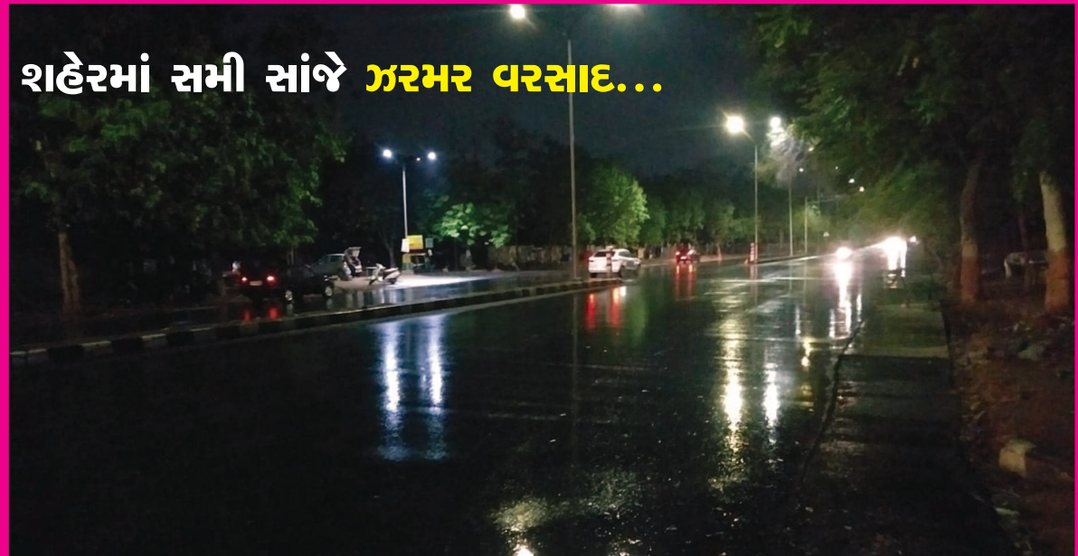
શહેરમાં સમી સાંજે ઝરમર વરસાદ...