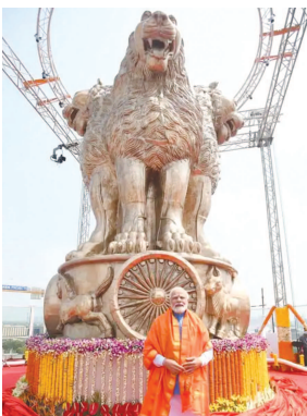
પર બનાવવામાં આવેલા રાષ્ટ્રીય અશોક ચિન્હનું અનાવરણ કર્યું

નરેન્દ્ર મોદીએ રાષ્ટ્રીય અશોક ચિન્હનું અનાવરણ કર્યું : આ અનાવરણ પ્રસંગે લોકસભા અધ્યક્ષ ઓમ બિરલા, કેન્દ્રીય મંત્રી હરદીપસિંહ પુરી સહિતના નેતાઓ ઉપસ્થિત નવી દિલ્હી, તા. ૧૧