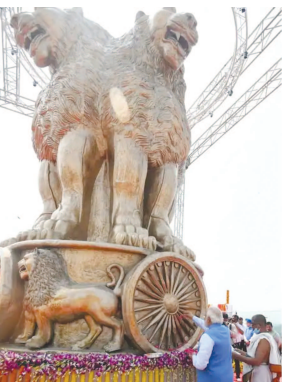
બિરલા, કેન્દ્રીય મંત્રી હરદીપસિંહ પુરી સહિતના નેતાઓ ઉપસ્થિત

હતું. આ રાષ્ટ્રીય પ્રતિકની ઉંચાઈ ૬.૫ મીટર છે. આ અનાવરણ પ્રસંગે લોકસભા અધ્યક્ષ ઓમ રહ્યા હતા. સરકારી અધિકારીઓએ આ રાષ્ટ્રીય પ્રતિક અંગે માહિતી આપતાં જણાવ્યું કે, પ્રધાનમંત્રીએ નવા સંસદ ભવનની છત પર જે રાષ્ટ્રીય પ્રતિકનું અનાવરણ કર્યું છે તે કાંસામાંથી બનેલું છે. ૬.૫ મીટર ઉંચાઈ ધરાવતા આ રાષ્ટ્રીય પ્રતિકનું કુલ વજન ૮,૫૦૦ કિલો છે. નવા સંસદ ભવનની છતની મધ્યમમાં આ પ્રતિમાને સ્થાપિત કરવામાં આવી છે. આ પ્રતિકને ટેકો આપવા માટે લગભગ ૬,૫૦૦ કિલો વજનનું સ્ટીલનું સહાયક માળખું બનાવવામાં આવ્યું છે.