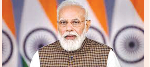
ગાંધીનગર, તા. ૧૭ વડાપ્રધાન નરેન્દ્ર મોદી ૨૮ અને ૨૯ જુલાઈના રોજ ગાંધીનગર આવી રહ્યા છે.

અગાઉ વડાપ્રધાન ૧૫ જુલાઈના રોજ ગુજરાત આવવાના હતા અને તેઓ હિંમતનગર તેમજ ગાંધીનગર ગિફ્ટસીટીના કાર્યક્રમમાં હાજરી આપનાર હતા. ભારે વરસાદને પગલે આ કાર્યક્રમ રદ થયા હતા. હવે ૨૮મી જુલાઈના રોજ આ કાર્યક્રમોનું આયોજન કરવામાં આવી રહ્યું જાણવા મળેલ છે. મળતી વિગતો પ્રમાણે ૨૮મીએ બપોર બાદ ગાંધીનગર આવી પહોંચશે. તેઓ ૨૮મીએ વરસાદે વેરેલા વિનાશ અંગે તંત્રએ કરેલી કામગીરી, રાહતકાર્ય તેમજ નુકશાનની વિગતો અંગેની સમીક્ષા કરશે તેમ મનાઈ રહ્યુ છે. ૨૮મીએ તેઓ સવારે હિંમતનગર સાબરમતીના કાર્યક્રમમાં હાજરી આપી વિવિધ પ્રકલ્પોનું ખાતમુહૂર્ત તેમજ લોકાર્પણ કરશે. આ પછી તેઓ ગાંધીનગર ગિફ્ટસીટીના કાર્યક્રમમાં હાજરી આપી દિલ્હી જવા રવાના થશે.