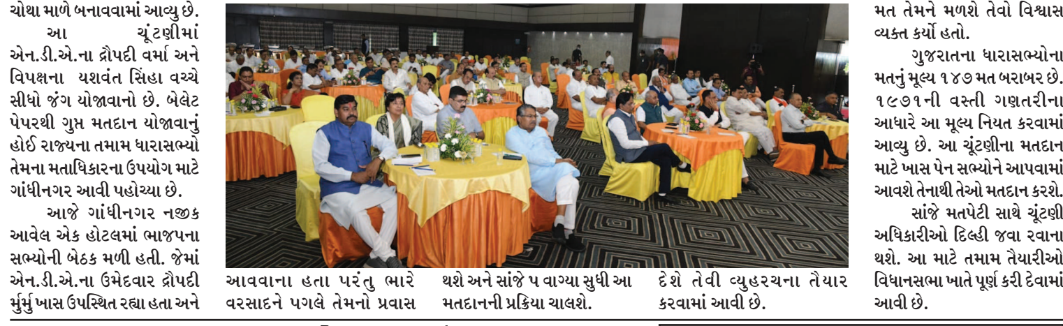
આવવાના હતા પરંતુ ભારે વરસાદને પગલે તેમનો પ્રવાસ થશે અને સાંજે પ વાગ્યા સુધી આ મતદાનની પ્રક્રિયા ચાલશે.

ગાંધીનગર, તા. ૧૭ રાષ્ટ્રપતિ પદ માટે આજે યોજાતી ચૂંટણીનું મતદાન મથક ગુજરાત વિધાનસભા સંકુલના ચોથા માળે બનાવવામાં આવ્યુ છે. આ ચૂંટણીમાં એન.ડી.એ.ના દ્રોપદી વર્મા અને વિપક્ષના યશવંત સિંહા વચ્ચે સીધો જંગ યોજાવાનો છે. બેલેટ પેપરથી ગુપ્ત મતદાન યોજાવાનું હોઈ રાજ્યના તમામ ધારાસભ્યો તેમના મતાધિકારના ઉપયોગ માટે ગાંધીનગર આવી પહોંચ્યા છે.