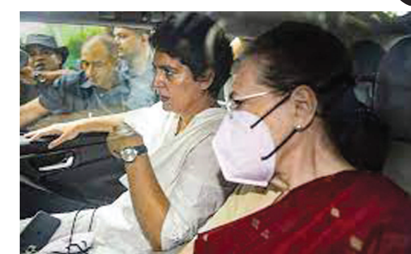
● અનુસંદાન પાન-૭ પર

ગુરુવારે ઈડી સમક્ષ કોંગ્રેસનાં અધ્યક્ષ હાજર થયા : બે કલાક પુછપરછ : ઈડીની કાર્યવાહીના વિરોધમાં કોંગ્રેસી કાર્યકરો રસ્તાઓ પર ઉતરી આવ્યા હતા