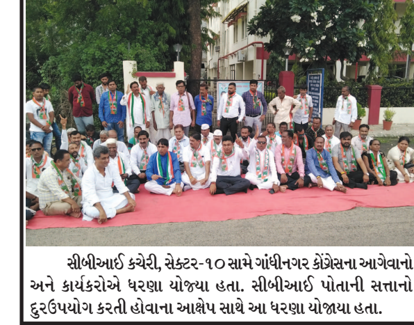
સીબીઆઈ કચેરી, સેક્ટર-૧૦ સામે ગાંધીનગર કોંગ્રેસના આગેવાનો અને કાર્યકરોએ ધરણા યોજ્યા હતા. સીબીઆઈ પોતાની સત્તાનો દુરઉપયોગ કરતી હોવાના આક્ષેપ સાથે આ ધરણા યોજાયા હતા.

લર્નીંગ સેન્સર આધારિત ડ્રોન ટેકનોલોજીનો ઉપયોગ કરી મચ્છરના ઉપદ્રવને ડામવા મહેસાણા જિલ્લાથી મુંબેશનો પ્રારંભ કરાવ્યો છે. આ આધુનિક ડ્રોન ટેકનોલોજી દ્વારા મચ્છરજન્ય રોગનું નિયંત્રણ કરવામાં આરોગ્ય વિભાગને સહાય મળશે. એટલે કે જે વિસ્તારોમાં ગ્રાઉન્ડ સર્વેલન્સ ટીમનું પહોંચવું મુશ્કેલ છે તેવા વિસ્તારોમાં ડ્રોનની મદદથી સ્પ્રેનો છંટકાવ કરવામાં આવશે. મહેસાણા જિલ્લા પંચાયત દ્વારા ખાનગી કંપની સહયોગ થી Artificial