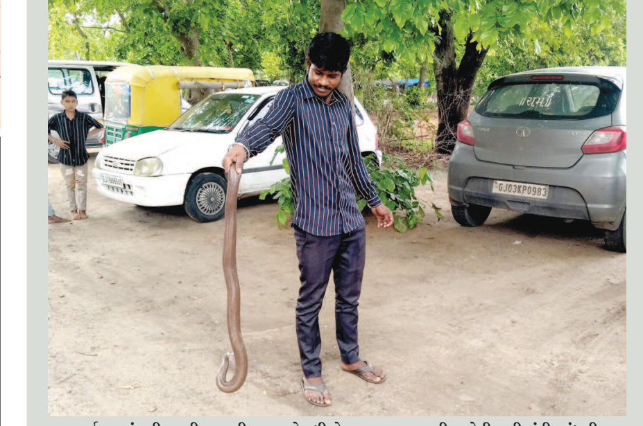
વર્ષોજુઓ સરીસૂપ નીકળવાની ઘટનાઓ વધી છે. અખબારભવનની સામેની ઝાડીમાંથી આંધળીયાકળા નીકળી આવી હતી. સપ્ટેમ્બરે તેને પકડીને જંગલ વિસ્તારમાં છોડી મુકી હતી.

હતું. ગુજરાતી સાહિત્ય પરિષદના ઉપક્રમે કવિની જન્મજયંતિ પ્રસંગે તા. ૨૧ મી જુલાઈના રોજ, એક માનવીય અભિગમ સાથેની નિરુપ્ત વિશે, એમના વિપુલ સાહિત્ય સર્જનની પણ વાત કરી કરવામાં આવ્યું હતું. કવિચેતનાને