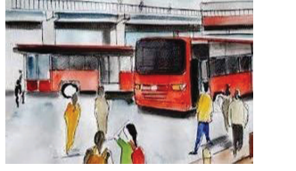
ભસ સ્ટેશન પર રાણીપ પહોંચ્યા પછી વાત-વાતમાં અજાય બહાભક

જમવાનું હોઈ યા નો પ્લાન ઈચ્છા હોવા છતાં કેન્સલ રાખવો પડ્યો. છેવટે પોણા કલાક સુધી રાહ જોવા પછી ભસ આવી! પણ તહેવાર ના હિસાબે અંદર ભીડ એટલી હતી કે ઉભુ રહેવાની જગ્યા પણ માંડ દેખાઈ. હાથ માં ર બેગ (એક માં પાણું લેપટોપ) હોવાના લીધે બેસવું કે નઈ એની અવઘવ માં હતો પણ મોડું થઈ ગયું હતું અને બીજા ભસ ના કોઈ અણસાર દેખાતા નહોતા એટલે "અંદર જઈને જોવું જવશે" ના નિર્ધાર સાથે ભસ માં ચઢ્યો. મારા કરતા મને લેપટોપ ની બેગ ક્યાં મૂકવી એની ચિંતા વધારે હતી. છેવટે રેક ઉપર પણ ખાલી જગ્યા ન દેખાતા મારા પગ ની આગળ જ બેગ મૂકી. બીજા બેગ કંડક્ટર ની સીટ ઉપર મૂકવાની વિનંતી કરી. કંડક્ટર ભલો માણસ હતો, સંમત થયો. ધક્કા ખાતા ખાતા પણ અંતે દસ ની જગ્યા એ સાડા દસ વાગે ગાંધીનગર પહોંચ્યો. થાક તો લાગેલો જ હતો પણ કહે છે ને કે "ધરતી ના જીવે ઘર". ઘરે પગ મૂકતા જ જાણે બધો જ થાક ઉતરી ગયો. ઘર માં પ્રવેશતા જ એ રસોડા તરફ દોટ મૂકી, જ્યાં મમ્મી ના હાથ નું પાવાનું મારી રાહ જોઈ રહ્યું હતું. મુસાફરી એ થકવી નાખેલો પણ પહેલો કોળીનો મોઢા માં જતાં જ લાગ્યું કે દુનિયા ની નિયમ છે કે કંઈક મળવાની કિંમત ત્યારે જ સમજાય જ્યારે એ મળતા પહેલા કંઈક અડચણ આવે.