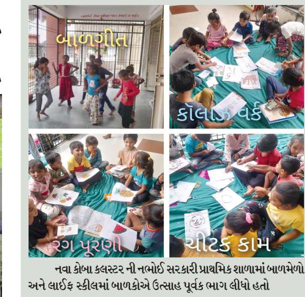
નવા કોષ્ટક કલસ્ટર ની નબોઈ સરકારી પ્રાથમિક શાળામાં બાળમળો અને લાઈફ સ્કીલમાં બાળકોએ ઉત્સાહ પૂર્વક ભાગ લીધો હતો