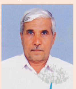
એસ એ. વાઘેલા