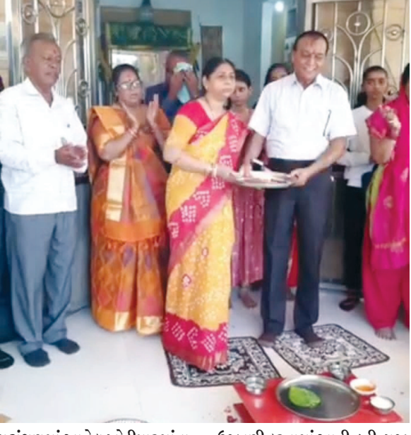
પટોંગણમાં આવેલ ખોડીયારમાંના ઉજવણી કરવામાં આવી હતી. પૂજા

ગાંધીનગર, તા. ૧ મંદિરે શાસ્ત્રોક્ત વિધિ પ્રમાણે હોમ ૧ જૂનના રોજ મધુર ડેરીના હવન પૂરી શ્રદ્ધા ને આરાધના સાથે