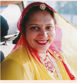
હિરલ પંત ગઢ