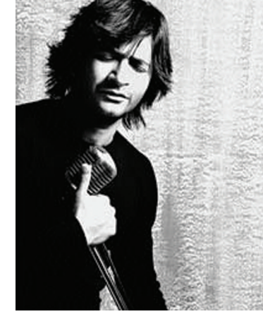
સાથે સંકળાયેલ જાણીતી વ્યક્તિ અણધારી વિદાય લેતી હોય છે ત્યારે મીડિયા એવું વાતાવરણ ઉભું કરતી હોય

'આવારપન, બંજારાપન, એક બલા હૈ, સીને મેં' - ગીતના ગાયક કે.કે. એ અણધારકી વિદાય લીધી. ફિલ્મ