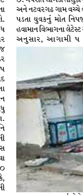
રાજ્યના વાતાવરણમાં મોટો ફેરફાર જોવા મળશે. કારણ કે, રાજ્યના વિવિધ વિસ્તારમાં થન્ડરસ્ટોર્મની અસર થશે. જેમાં પવનની ગતિ પણ ૩૦ થી ૪૦ પ્રતિ કલાકની રહી શકે છે. આજથી ૧૦ જૂન કેટલાક વિસ્તારમાં ઊળવો વરસાદ પડી શકે છે. તો દક્ષિણ ગુજરાતના કેટલાક થન્ડર સ્ટોર્મની અસર મંગળવારે રાજ્યના ૫ જિલ્લામાં જોવા મળી હતી. ગઈકાલે

અમદાવાદ, તા. ૮ આગામી ૫ દિવસ રાજ્યના વાતાવરણમાં મોટો બદલાવ થશે. કારણ કે, રાજ્યના વિવિધ વિસ્તારમાં થન્ડરસ્ટોર્મની અસર જોવા મળશે. જોકે, મંગળવારથી જ તેની અસર જોવા મળી છે. થન્ડર સ્ટોર્મની અસરથી રાજ્યના ૫ જિલ્લાના ૧૨ તાલુકામાં વરસાદ નોંધાયો છે. સાથે જ પાટણના સાંતલપુર તાલુકામાં ભારે પવન સાથે વરસાદ તૂટી પડતા ૧૦ વધુ મકાનોના પતરાં ઉડ્યા હતા. સદનસીબે તેમાં મોટી જાનહાનિ ટળી હતી. આમ, થન્ડર સ્ટોર્મની અસર વચ્ચે આગામી ૫ દિવસ રાજ્યના વાતાવરણમાં પલટો જોવા મળશે, પવનની ગતિ ૩૦ થી ૪૦ કિલોમીટર પ્રતિ કલાકની રહી શકે, જોકે ઉત્તર ગુજરાતમાં વરસાદની સંભાવના નહીવત્ છે. તેમજ પ્રથમ વરસાદની વીજળીએ લીબડી તાલુકાના એક યુવકનો ભોગ લીધો