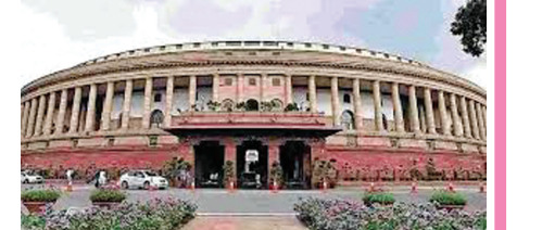
રાજ્યસભાની ચૂંટણી માટે મતદાન થવા જઈ રહ્યું છે.

નવી દિલ્હી,તા.૯ રાજ્યસભાની ચૂંટણીને લઈને રાજકીય માહોલ ગરમ થઈ રહ્યું છે. ચૂંટણીને હવે ગણતરીના કલાકો જ બાકી રહ્યા છે. રાજ્યસભાની ૫૭ બેઠકો પૈકી ૧૬ બેઠકો પર ચૂંટણી યોજાશે. રાજ્યસભાની ૧૬ બેઠકો માટે ૧૦ જૂનના રોજ ૪ રાજ્યોમાં મતદાન થવા જઈ રહ્યું છે. જેમાં મહારાષ્ટ્ર, રાજસ્થાન, હરિયાણા અને કર્ણાટકનો સમાવેશ કરવામાં આવ્યો છે. આ ૧૬ બેઠકોનું સંપૂર્ણ ગણતરી નીચે રજૂ કરાયું છે. મહારાષ્ટ્રમાં રાજ્યસભાની ૬ બેઠકો પર ચૂંટણી યોજાશે. આ ૬ બેઠકો પર કુલ ૭ ઉમેદવારો મેદાનમાં છે. જેમાં ભાજપના ૨ ઉમેદવારો તેમજ કોંગ્રેસ, એનસીપી અને શિવસેનાના ૧-૧ ધારાસભ્યો આસાનીથી જીતી શકે છે. આ ઉપરાંત મહા વિકાસ અઘરી (એમવીએ)માં સામેલ ૩ પક્ષો પાસે બીજી બેઠક જીતવા માટે વધારાના મત