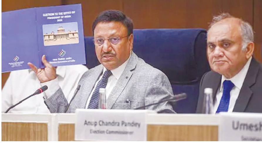
અનુપ ચંદ્ર પાંડે અને ઉમેશ ચંદ્ર પાંડે રાષ્ટ્રપતિ ચૂંટણી માટેની તારીખો જાહેર કરી રહ્યા છે.

૨૧ જુલાઈએ પરિણામ : રાષ્ટ્રપતિની ચૂંટણી માટે મતદારોની કુલ સંખ્યા ૪૮૦૯ છે, જેમાંથી ૭૭૬ સાંસદ છે અને ૪૦૩૩ ધારાસભ્યો છે, હાલના રાષ્ટ્રપતિ રામનાથ કોવિંદનો કાર્યકાળ ૨૪ જુલાઈના રોજ પૂર્ણ થઈ રહ્યો છે : ચૂંટણી પંચે રાષ્ટ્રપતિની ચૂંટણીની તારીખો જાહેર કરી