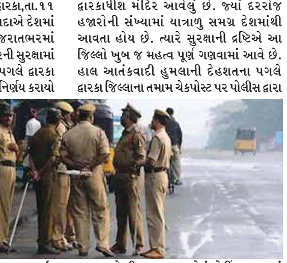
દ્વારકાથી જગત મંદિર આવેલું છે. જ્યાં દરરોજ હજારોની સંખ્યામાં યાત્રાળુ સમગ્ર દેશમાંથી આવતા હોય છે. ત્યારે સુરક્ષાની દ્રષ્ટિએ આ જિલ્લો ખુબ જ મહત્વ પૂર્ણ ગણવામાં આવે છે. હાલ આતંકવાદી હુમલાની દેહશતના પગલે દ્વારકા જિલ્લાના તમામ ચેકપોસ્ટ પર પોલીસ દ્વારા

દ્વારકા, તા. ૧૧ આતંકવાદી સંગઠન અલકાયદાએ દેશમાં હુમલાની ધમકી આપ્યા બાદ ગુજરાતભરમાં એલર્ટ અપાયું છે. ત્યારે દ્વારકા મંદિરની સુરક્ષામાં વધારો કરાયો છે. હાઈ એલર્ટને પગલે દ્વારકા મંદિરમાં શ્રી લેયર સુરક્ષા રાખવાનો નિર્ણય કરાયો છે. હાલમાં દ્વારકા જિલ્લાની તમામ ચેકપોસ્ટ પર વાહનોનું ચેકિંગ કરાઈ રહ્યું છે. ભીડભાડવાળા વિસ્તારોમાં પોલીસ બાજુ નજર રાખી રહી છે. દ્વારકા મંદિરમાં ઝડૂક થી પણ વોચ રાખવામાં આવી રહી છે. સમગ્ર રાજ્યમાં આતંકવાદી હુમલાના ઈનપુટના પગલે સુરક્ષા હાઈ એલર્ટ પર છે. ત્યારે જગત મંદિર દ્વારકાથી જાતે શ્રી લેયર સુરક્ષા કરાઈ. આતંકવાદી સંગઠન અલકાયદા દ્વારા ગુજરાતમાં હુમલાની ધમકીના પગલે સમગ્ર ગુજરાત હાઈ એલર્ટ પર છે. ત્યારે દ્વારકા ખાતે આવેલ દ્વારકાથી જગત મંદિરની સુરક્ષામાં પણ વધારો કરાયો છે. દ્વારકા જિલ્લા કે જે ૩ તરફથી સમુદ્ર સાથે ઘેરાયેલો હોઈ તે સુરક્ષાની દ્રષ્ટિએ અતિ મહત્વપૂર્ણ ગણાય છે. અહીં જગ વિખ્યાત