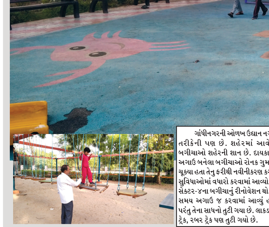
ગાંધીનગરની ઓળખ ઉદ્યાન નગરી તરીકેની પાછ છે. શહેરમાં આવેલા બગીચાઓ શહેરની શાન છે. દાયકાઓ અગાઉ બનેલા બગીચાઓ રોનક ગુમાવી ચુક્યા હતા તેનું ફરીથી નવીનીકરણ કરીને સુવિધાઓમાં વધારો કરવામાં આવ્યો છે. સેક્ટર-૪ના બગીચાનું રીનોવેશન થોડાક સમય અગાઉ જ કરવામાં આવ્યું હતું. પરંતુ તેના સાધનો તુટી ગયા છે. લાકડાનો ટ્રેક, રબર ટ્રેક પણ તુટી ગયો છે.

ગાંધીનગર, તા. ૧૧ ગાંધીનગર શહેરમાં આજે કોરોનાના વધુ પાંચ કેસ નોંધાયા છે જ્યારે ગ્રામ્ય વિસ્તારમાં કોરોનાનો એક પણ નવો કેસ નોંધાયો નથી. ગાંધીનગર શહેરમાં લોકલ ટ્રાન્સમિશન ઝડપથી થઈ રહ્યુ હોવાથી તંત્રની ચિંતા વધી છે. શહેરમાં કેસોની ગતિ વધી છે. શહેરમાં જે રીતે કેસો સામે આવી રહ્યા છે તેને લઈ તંત્રની ચિંતા વધી છે. ગાંધીનગર શહેરમાં આજે કોરોનાના વધુ પાંચ કેસ નોંધાયા છે જેમાં ગાંધીનગર શહેરમાં સમાવિષ્ટ ગ્રામ્ય વિસ્તારમાં ૪ તેમજ શહેરમાં સૌથી વધુ વસ્તી ધરાવતા સે. ૨૪માંથી એક કેસ મળી આવેલ છે. આજે નોંધાયેલ પાંચ કેસમાં બે દર્દી કોવિડ-૧૯થી સંક્રમિત થયેલા દર્દીના સંપર્કમાં આવતાં સંક્રમિત થયા છે. તો બે દર્દી કોઈપણ પ્રકારની ટ્રાવેલ હિસ્ટ્રી ધરાવતા નથી. એક દર્દી મહેસાણા ખાતે ભાઈના લગ્નમાં હાજરી આપી પરત ફર્યા બાદ કોરોનામાં સપડાયાનું જાણવા મળેલ છે.