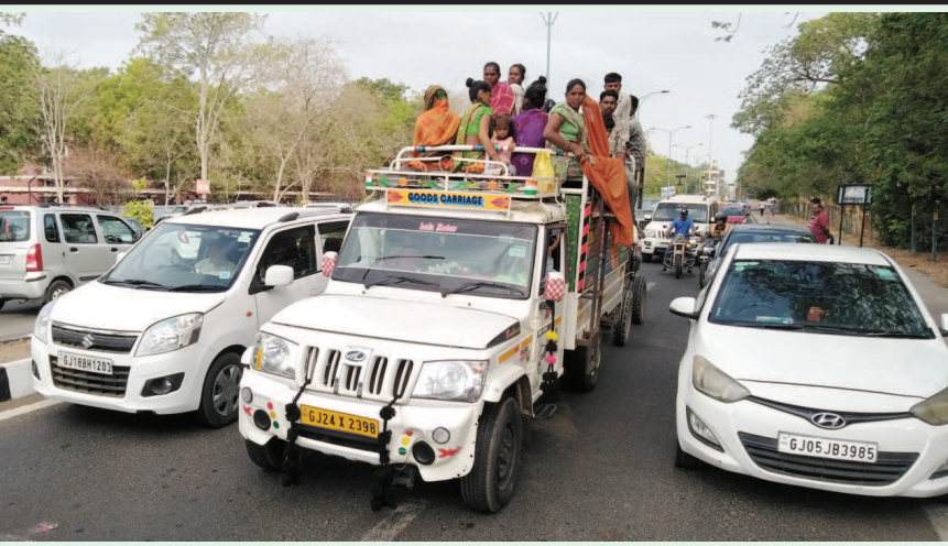
મુસાફરોની આવનજાવન વધી છે પરંતુ તેની સામે જાહેર પરિવહનના એસટી બસ સેવા સાધનોની સુવિધા વધી ન હોવાથી મુસાફરોને ના છૂટકે ખાનગી વાહનોનો સહારો લેવો પડે છે. મોંઘવારીના સમયમાં વધુ નફો કમાવવાની લાલચમાં ખાનગી વાહનો મુસાફરોને ઠાંસી ઠાંસીને ભરે છે. જે ક્યારેક ભયજનક બની શકે છે.

ગાંધીનગર, તા. ૧૪ ગાંધીનગરના વાવોલ વિસ્તારમાં વિકાસે ઝડપ પકડી છે અને નવા રસ્તાઓના વિકાસ સાથે તંત્ર દ્વારા ભાગ-બગીચા સહિત વિવિધ સુંદરતામાં વધારો થવા સાથે ભુગર્ભ જળમાં પણ તેના થકી વધારો થશે અને તે શહેરના પર્યાવરણ માટે ખૂબ લાભદાયી સાબિત થશે. ગાંધીનગરના વાવોલ વિસ્તારમાં ટીપી-૧ ઉમાં "ક" રોડથી બાયપાસ માર્ગ તરીકે વિકસાવાયેલાં નવ ડપ મીટરના રોડ પર શાંતિવન સોસાયટી સામે એક આંબાવાડિયું આવેલું છે જ્યાં રોડ ટચ જોગણીમાતાનું એક નાનું મંદિર પણ છે. આ મંદિરનું તાજેતરમાં જ નજીકની સોસાયટીઓના શ્રદ્ધાળુઓએ મળીને રિનોવેશન કર્યું છે. જોગણીમાતાના મંદિરને અડીને જે આંબાવાડિયું છે તે હકીકતમાં અગાઉ તળાવ હતું અને તે આ વિસ્તારના જૂના નકશામાં પણ છે અને હાલ ટીપી-૧ ડાબા બનાવાયેલાં નકશામાં પણ તળાવ તરીકે દર્શાવાયેલું છે. આ તળાવમાં હાલ પાણી નથી પરંતુ આગામી સમયમાં વહીવટીતંત્ર દ્વારા આ તળાવને પુનર્જીવિત કરવાની વિચારણા ચાલી રહી છે. જોકે આ વિસ્તારના રહીશોમાં અહીં બગીચો બને તેવી લાગણી પ્રવર્તી રહી હતી પરંતુ આ વિસ્તારમાં નજીકમાં જ મનપા દ્વારા એકથી વધુ બગીચાનો વિકાસ કરાયો છે અને હજુ વધુ એક બગીચો નિર્માણ હેઠળ છે, જ્યારે આ કુદરતી અને કાયદેસર રીતે તળાવ જ હોવાથી તેને તળાવ તરીકે પુનર્જીવિત કરીને વાવોલ વિસ્તારમાં નવા સોસાયટી વિસ્તારને પણ તળાવનો લાભ મળે તેવા હેતુથી તે તળાવને પુનર્જીવિત કરવાનો નિર્ણય લેવાઈ ગયો હોવાનું જાણવા મળ્યું છે.