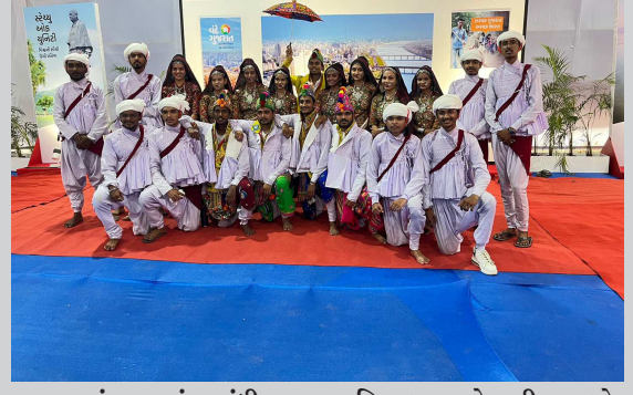
પ્રારંભ કલાવુંદ, ગાંધીનગર દ્વારા રિવરફ્રન્ટ ખાતે પ્રાચીન ગરબો, મણિયારો રાસ જેવા ગુજરાતી લોકપ્રિય ગરબા પરફોર્મન્સ કરવામાં આવ્યું હતું જેમાં આ ગ્રુપે લોકોને મંત્રમુગ્ધ કરી મુક્યા હતા.

ગાંધીનગર, તા. ૧૮ અડાલજ ગામની સીમમાં નર્મદા કેનાલ જોગણી માતાના મંદિર નજીક બ્રિજ થી ઝુંડાલ તરફ જતા રોડ પાસે ખાડામાંથી પુરુષ અને મહિલાની હત્યા કરી મૃતદેહ સળગાવેલી હાલતમાં કંકાલ મળી આવ્યા હતા. અડાલજ પાસેથી મળી આવેલા કંકાલને પગલે પોલીસ તંત્રએ છેલ્લા ૧૨ દિવસથી રાત દિવસ એક કરી સીસીટીવી ફુટેજ તેમજ છેલ્લા કેટલાક માસનો ડેટા એક્ટ કરીને વિવિધ ટિપ્પણીઓ તપાસ હાથ ધરી છે. જ્યારે રાજ્યના તમામ શહેરમાં ગુમ કપલ અંગે પોલીસ ટીમ મોકલી આપીને પોસ્ટર લગાવવામાં આવશે. જ્યારે સ્થાનિક પોલીસની સાથે એલસીબી-૧,૨ તેમજ એસએજીની ટીમ સહિત ૬૦ થી વધુ પોલીસ જવાનોની ટીમ કામે લાગી છે.