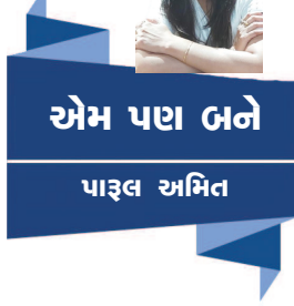
એમ પાઠ બને પાઠ્ઠલ અમિત

અક્ષોહિણી સેના હતી. અર્જુન ગીતા જ્ઞાન પામે છે એ સમયમાં જવાનો મોકો મળે તો ? શું સાચે જ અનારકલીને જીવતી દીવાલમાં જીવતી થઈ હતી ? એવી પણ શંકા દિમાગમાં આંટો મારી જાય છે ? મિત્રો ભૂતકાળ રસપ્રદ અને રહસ્યમય તો જ વર્તમાનમાં મજા આવે ખરે ને ? ચાલો ભૂતકાળ માં જઈ અડપલુ કરી આવીએ. સાંભળવું છે કે જે કોઈ સર્વંધો આપણે જીવી રહ્યાં છીએ એ ખૂદાનું બંધ છે. કર્મ ના ફળ મુખબ જ મળે છે જીંદગીમાં સઘળું બસ આ સિદ્ધાંતને દિલથી અપનાવાય તો સાચું. આપણું જીવન અનેક રહસ્યોથી ભરેલું છે, રોજ ઘણાં કરતાં નવા નવા પ્રકરણ ખુલતા રહે છે, અને આપણે એ જ ચિંતામાં ભવિષ્યની બધી શક્તિ ગુમાવી બેસીએ છીએ. એ ભૂતકાળને હંમેશાં ખરાબ ચીટરીએ છીએ. જો મહાભારત ના રચાયું હોત તો ગીતા જ્ઞાન મળત ખરું. કળયુગ માટે આ જ્ઞાન કેટલાં વર્ષો પહેલાં રચાયું. કેટલું પૂર્વ સાચોવિત. છતાં આપણે ભવિષ્યની ચિંતામાં વર્તમાન ગુમાવીએ છીએ. ઘણીવાર ભૂતકાળના દુઃખો ( જે ખરા અર્થમાં દુઃખ હોતા