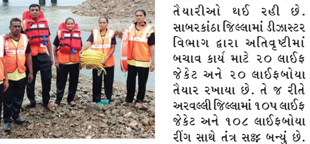
વિસ્તારોમાં પાણી ભરાઈ જવાથી જિલ્લામાં ચોમાસાના આગમન

અતિવૃષ્ટીના કારણે જળતરબોડની સ્થિતિ ઉભી થતી હોય છે. નીચાણવાળા વિસ્તારોમાં પૂર સમયે પાણીમાં માનવ તેમજ પશુઓ તથા જીવાના કિસ્સા નોંધાતા હોય છે.