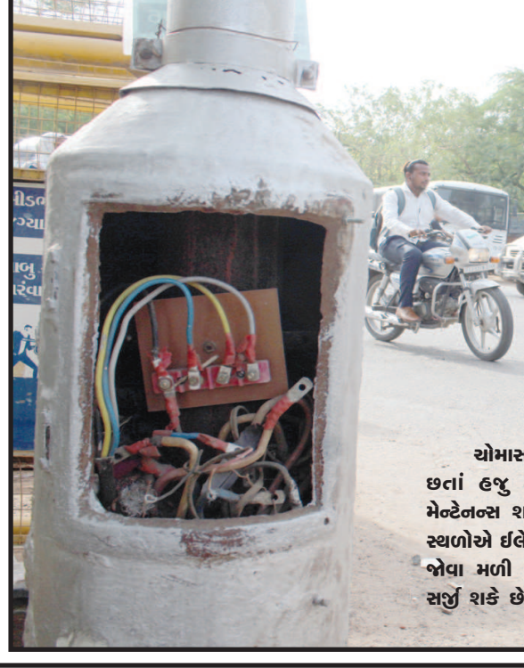
યોમાસાની સીઝન શરૂ થઈ ગઈ છે તેમ છતાં હજુ શહેરમાં ઈલેક્ટ્રીક યાંભલાનું મેન્ટેનન્સ શરૂ કરવામાં આવ્યું નથી. ઘણા સ્થળોએ ઈલેક્ટ્રીક યાંભલાના ડાંકણ તૂટેલા જોવા મળી રહ્યા છે જે કચાકે અકસ્માત સર્જી શકે છે.

ગાંધીનગર, તા. ૨૯ અષાઢી બીજ નિમિત્તે પેથાપુર ખાતે ભવ્યાતિભવ્ય રથયાત્રા યોજાશે. પરંપરાગત રૂટ પર નીકળતી રથયાત્રા માટેની તૈયારીઓ પૂર્ણ કરી દેવાઈ છે. શ્રી પેથાપુર રથયાત્રા મહોત્સવ સમિતિ દ્વારા રથયાત્રાની તૈયારીઓનું સુદૃઢ આયોજન કરવામાં આવ્યું છે.