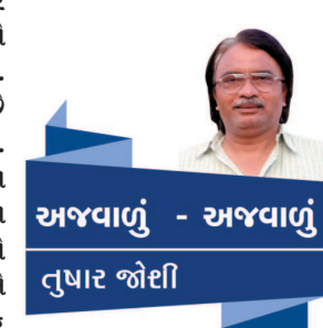
અજવાળું - અજવાળું તુષાર જોઈ

તેમાં પ્રવેશદારની ઊંચાઈ ઓછી હોય એટલે થોડો ઝુકીને, શિવ દરબારમાં જવું પડે. વિનમ્રતા અને સરળતાને આત્મસાત કરીને, અહંકાર છોડીને શિવ સુધી પહોંચી શકાય છે. શિવ સ્વરૂપમાં ત્રીજું નેત્ર જ્ઞાન યજ્ઞ જે વિવેકપૂર્ણ દૈષ્ટિ આપે છે, ભસ્મ વૈરાગ્યનો સંકેત આપે છે, ચંદ્ર શીતળતાનો અને ડમરું મસ્તીનું પ્રતિક છે. ત્રિસુણ જ્ઞાન-કર્મ-ભક્તિનું - વ્યાધામ્બર સાહસ અને પૌરુષનું અને જળાધારીથી ટપકતું પાણી સાતત્યનું પ્રતિક છે. માતા પાર્વતી ભક્તિનો સંદેશ આપે છે. થોડું સમજવાથી - થોડું પામવાથી - શિવ સ્વરૂપને વધુ ભક્તિને - વધુ સમર્પણથી પામી શકાય એની અનુભૂતિ મોતને થઈ ને નાના રાજ થયા. શિવરાત્રીનું પવ્વ શીવ સાધનાનું - શીવ ઉપાસનાનું પવ્વ છે. આપણે પણ પ્રાર્થના કરીએ તમને મન: શિવ સંકલ્પ મસ્તુ... અમારું મન શુભ સંકલ્પોવાળું બનો. શુભ સંકલ્પો સાકાર થાય અને શિવતત્વના અજવાળા રેલાય.