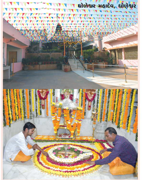
ધોળેશ્વર મહાદેવ મંદિર

ગાંધીનગર પાસે સાબરમતી નદીને કિનારે નયનરમ્ય વાતાવરણમાં ભગવાન ભોળાનાથ બિરાજમાન છે જેનું નામ ધોળેશ્વર મહાદેવ. ધોળેશ્વર મહાદેવ મંદિરને ગુજરાતના કાશી વિશ્વનાથની ઉપમા અપાઈ છે. જે વ્યક્તિ કાશીમાં વિશ્વનાથના દર્શન નથી કરી શકતો તેને કળયુગમાં ગંગા કરચપ પુત્રી સાબરમતીનું સ્નાન અને ભગવાન ધોળેશ્વરના દર્શન કરી કાશીમાં ગંગા સ્નાન અને કાશી વિશ્વનાથના દર્શનનું ફળ મળી જાય છે. પહેલાના સમયમાં ભગવાન ધોળેશ્વરનું નામ ઈન્દ્રદેવ મહાદેવ હતું. પૌરાણિક કથા મુજબ પૂના પેશ્વાની સરકારમાં કડીમાં મહારાજ મલ્હાર રાવ નામે સુબેદાર રાજ કરતા હતા. તે વખતે રાજની ઘોડશાળામાંથી ઘોડાઓની ચોરી કરી નાસી રહેલી ચોર ટોળીનો રાજ્યના સૈનિકોએ પીછો કર્યો અને ચોર બચવા માટે શિવાલયમાં સંતાઈ ગયા હતા અને બાજુમાં ધૂણી ધખાવીને બેઠેલા સંતને બચાવવા માટે આજીજી કરતાં સંતે ફરીથી આવું કૃત્ય નહીં કરવાની શરતે બચાવ્યા. પરંતુ તેમણે ચોરેલા ઘોડા લાલ અને કાળામાંથી ધોળા થઈ ગયા. ઘોડાના રંગ બદલઈને ધોળા થવાનાં પગલે ઈન્દ્રદેવ મહાદેવ ધોળેશ્વર મહાદેવના નામથી ખ્યાતિ પામ્યા હતા.