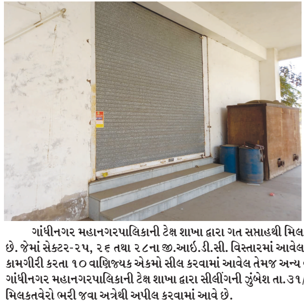
ગાંધીનગર મહાનગરપાલિકાની ટેક્ષ શાખા દ્વારા ગત સપ્તાહથી મિલકતવેરા વસુલાતની ઝુંબેશ અંતર્ગત હાલ સીલીંગની કામગીરી ચાલુ છે. જેમાં સેક્ટર-૨૫, ૨૬ તથા ૨૮ના જી.આઈ.ડી.સી. વિસ્તારમાં આવેલ મોટા બાકીદારો પેકીના ૩૦ વાણિજ્યિક એકમોમાં રૂબરૂ સીલીંગની કામગીરી કરતા ૧૦ વાણિજ્યિક એકમો સીલ કરવામાં આવેલ તેમજ અન્ય વાણિજ્યિક એકમો પાસેથી રૂ. ૩૬ લાખ જેટલી વસુલાત મેળવેલ છે. ગાંધીનગર મહાનગરપાલિકાની ટેક્ષ શાખા દ્વારા સીલીંગની ઝુંબેશ તા.૩૧/૦૩/૨૦૨૨ રુચી ચાલુ રહેનાર છે. જેથી બાકીદારોને સત્વરે બાકી મિલકતવેરો ભરી જવા અત્રેથી અપીલ કરવામાં આવે છે.