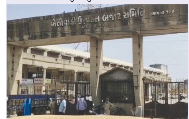
નામ. આ સંસ્થા ખેડૂતોની છે પરંતુ અહીં ખેડૂતો જ લૂંટાઈ રહ્યા છે. પહેલા કરોડોમાં શેષ કોભાડ આચરવામાં આવ્યું અને હવે ખેડૂતો સાથે વજન કાંટા માં ગોલમાલ કરી ઉઘાડી લૂંટ ચલાવવામાં આવી રહી છે. અરવલ્લી જિલ્લાના એક જાગૃત ખેડૂત મોડાસા છંદ્રક માં પોતાનો માલ લઈને ગયા હતા જ્યાં ખેડૂત દ્વારા એક વેપારીના ત્યાં વજન કાંટા માં વજન કરાવ્યું હતું જેમાં વજન ઓછું થયું હોવાનું સામે આવતા ખેડૂત ચોકી ઉઠ્યો હતો. ખેડૂત ને શંકા જતા અન્ય વેપારીને ત્યાં ફરી વજન કરવામાં માટે પહોંચ્યો હતો જેમાં ખેડૂત દ્વારા વજન કરવામાં આવતા મોટો તફાવત સામે આવ્યો હતો. પહેલા વેપારીના ત્યાં કરાવેલા વજન માં ૨૫૬૦ કિલો નેટ વજન આવ્યું હતું જ્યારે અન્ય એક વેપારીને ત્યાં વજન કરાવતા ૩૪૦૦ કિલો વજન આવ્યું હતું. બંને કાંટા પર કરવામાં આવેલાં વજનમાં ૮૪૦ કિલો નો મોટો તફાવત સામે

છે તેના જવાબદાર માન ને માત્ર સત્તાધીશો છે. તેમની રહેમ નજર હેઠળ વેપારીઓ ખેડૂતોને લૂંટી રહ્યા છે તે ફરી એકવાર સાબિત થયું છે. એક ખેડૂત પાસેથી ૮૦૦ કિલો કરતા વજન મારી લેવામાં આવે છે જે અંદાજ પ્રમાણે રોજનું લાખો રૂપિયાની ઉઘાડી લૂંટ મોડાસા માર્કેટ યાર્ડમાં કરવામાં આવી રહી છે. આવા વેપારીઓનું તાત્કાલિક લાઈસન્સ રદ કરી તેમનું લાઈસન્સ બ્લેક લિસ્ટ કરવામાં આવે તેવી ખેડૂત એકતા મંચ આંગ કરે છે. સાથેજ જે વજન ઘટ આવી છે તેની ભરપાઈ વેપારી પાસેથી કરી તે નાણાં તાત્કાલિક ખેડૂતને ચૂકવવામાં આવે અને મોડાસા છંદ્રક માં આવેલા તમામ કાંટાઓ