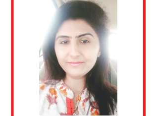
હેમોકાળેન રાજયકુમાર પટેલ તલાઈ કમ મંત્રી બાયડ જુલો અરવલ્લી