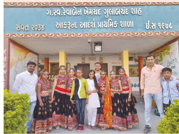
આકરુન્દ આદર્શ પ્રાથમિક શાળાની વિદ્યાર્થીનીઓ જિલ્લા કક્ષાએ પ્રથમ આવી. બાળ પ્રતિભા શોધ જિલ્લા કક્ષાની વિવિધ સ્પર્ધાઓ મોડાસા બી. આર.સી. ખાતે યોજાઈ ગઈ. જેમાં સમૂહનૃત્ય સ્પર્ધામાં આકરુન્દ આદર્શ પ્રાથમિક શાળાની વિદ્યાર્થીનીઓ જિલ્લા કક્ષાએ પ્રથમ આવી શાળાનું ગૌરવ વધાર્યું છે. તાજેતરમાં જ નિબંધ સ્પર્ધામાં રાજ્ય કક્ષાએ ઉન્નત્ક પ્રદર્શન કરી આવેલ આકરુન્દ આદર્શ પ્રાથમિક શાળા હવે સમૂહનૃત્ય સ્પર્ધામાં રાજ્ય કક્ષાએ અરવલ્લી જિલ્લાનું પ્રતિનિધિત્વ કરશે. જે બદલ તાલુકા પ્રાથમિક શિક્ષણાધિકારી, બી. આર.સી., સી.આર.સી. કો. આ., શાળા આચાર્ય, શાળા સ્ટાફ અને એસ.એમ.સી. સભ્યો એ અભિનંદન પાઠવ્યા હતા.