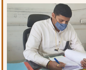
તેમના વિરોધમાં સમગ્ર ગુજરાતમાં તમામ મામલતદાર કચેરી ખાતે કર્મચારીઓએ કાળી પટ્ટી ધારણ કરી વિરોધ નોંધાવ્યો હતો. ભારતીય જનતા પાર્ટીના ભરૂચના સાંસદ મનસુખભાઈ વસાવા દ્વારા કરજણ મામલતદાર સાથે જાહેરમાં અભદ્ર વર્તન કરતા સમગ્ર ગુજરાતમાં તમામ મામલતદાર કચેરી

ખાતે કરજ બજાવતા મામલતદાર તેમજ કર્મચારીઓમાં ભારે રોષ જોવા મળી રહ્યો છે. ત્યારે આજે સાંસદ મનસુખભાઈ વસાવાના