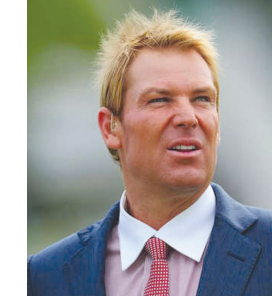
શેન વોર્નના નિધન પૂર્વ અને વર્તમાન ક્રિકેટરો તેમને શ્રદાંજલિ આપી રહ્યા છે. પ્રાપ્ત

નવી દિલ્હી, તા. ૪ ક્રિકેટ જગતમાંથી સૌથી દુખભર્યા સમાચાર સામે આવી રહ્યા છે. ઓસ્ટ્રેલિયાના દિગ્ગજ પૂર્વ ક્રિકેટર અને વિશ્વના મહાન સ્પિનરોમાં સામેલ શેન વોર્નનું હાર્ટ એટેકને કારણે ૫૨ વર્ષની ઉંમરે નિધન થયું છે. શેન વોર્ન ટેસ્ટ ક્રિકેટમાં ૭૦૮ વિકેટ ઝડપી હતી. આ સિવાય વનડે ક્રિકેટમાં તેના નામે ૨૯૩ વિકેટ છે. શેન વોર્નનો જન્મ ૧૩ સપ્ટેમ્બર ૧૯૬૯માં થયો હતો.