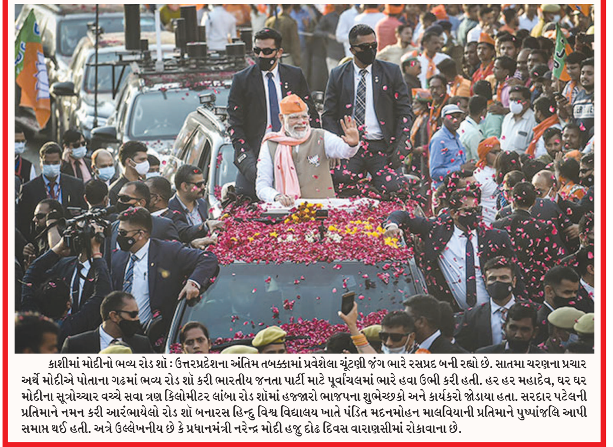
કાશીમાં મોદીનો ભવ્ય રોડ શો : ઉત્તરપ્રદેશના અંતિમ તબક્કામાં પ્રવેશેલા ચૂંટણી જંગ ભારે રસપ્રદ બની રહ્યો છે. સાતમા ચરણના પ્રચાર અર્થે મોદીએ પોતાના ગઠમાં ભવ્ય રોડ શો કરી ભારતીય જનતા પાર્ટી માટે પૂર્વાવધવામાં ભારે હવા ઉભી કરી હતી. હર હર મહાદેવ, ઘર ઘર મોદીના સુત્રોચ્ચાર વચ્ચે સવા ત્રણ કિલોમીટર લાંબા રોડ શોમાં હજારો ભાજપના શુભેચ્છકો અને કાર્યકરો જોડાયા હતા. સરદાર પટેલની પ્રતિમાને નમન કરી આરંભાયેલો રોડ શો બનારસ હિન્દુ વિશ્વ વિદ્યાલય ખાતે પંડિત મદનમોહન માલવિયાની પ્રતિમાને પુષ્પાંજલિ આપી સમાપ્ત થઈ હતી. અત્રે ઉલ્લેખનીય છે કે પ્રધાનમંત્રી નરેન્દ્ર મોદી હજુ દોઢ દિવસ વારાણસીમાં રોકાવાના છે.

રશિયા અંગે ભારતના વલણમાં કોઈ ફેરફાર થયો નથી. ફરી એકવાર તે રશિયાની નિંદાના પ્રસ્તાવ પર તટસ્થ રહ્યા. આ પ્રસ્તાવ સંયુક્ત રાષ્ટ્ર માનવધિકાર પરિષદમાં લાવવામાં આવ્યો હતો. કાઉન્સિલે તેનો ઉર મતોથી સ્વીકાર કર્યો હતો. ભારત અને ચીન સહિત ૧૩ દેશોએ તેમાં ભાગ લીધો ન હતો. શુક્રવારે સંયુક્ત રાષ્ટ્ર માનવધિકાર પરિષદમાં રશિયાની નિંદા કરતા પ્રસ્તાવથી ભારત ફરી દૂર રહ્યું. આ પ્રસ્તાવ યુકેનમાં રશિયાની સૈન્ય કાર્યવાહીમાં માનવધિકારના ઉલ્લંઘનના સંદર્ભમાં લાવવામાં આવ્યો હતો. તેને જંગી મતોથી અપનાવવામાં આવ્યું હતું. દરખાસ્તની તરફેણમાં