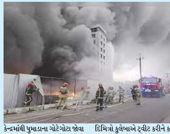
કેન્દ્રમાંથી ધુમાડાના ગોટેગોટા જોવા દિશિત્રો કુલેબાએ ટ્રીટ કરીને કહ્યું

કીવ, તા. ૪ રશિયા અને યુકેન વચ્ચે ચાલી રહેલા યુદ્ધને આજે નવમો દિવસ છે. હાલાત બદલી બદલતર થઈ રહ્યા છે. શક્તિશાળી રશિયા સતત યુકેનને વેરવિખેર કરવામાં લાગ્યું છે. બંને બાજુથી જાનમાલનું ખુબ નુકસાન થઈ રહ્યું છે. આ બધા વચ્ચે એક ચિંતાજનક સમાચાર એ છે કે હર્સોલિરડરેટ 'હર્સોલિર પ્રાંતના એનરલોદર શહેરમાં રશિયાએ મોટો હુમલો કર્યો છે. યુકેનની અધિકારીનો દાવો છે કે આ હુમલા બાદ ઝેપોરીજિયા સ્થિત