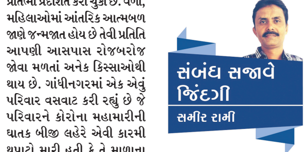
સંબંધ સજાવે જિંદગી સર્મા રામી

પોતાના ઘરના વાઈ-ફાઈનો પાસવર્ડ પણ જેમને ખબર નોહતી તેવી આ સાસુ વધુની જોડીએ લાઈટબીલ, ગેસબીલ વગેરેના પેમેન્ટ સાથે આનલાઈન બેંકીંગ પણ શીખી લીધું અને દિકરી જમાઈના મદદથી ફરી સોશિયલ મિડીયાના માધ્યમથી એક યુપ બનાવી ‘કુકીંગ કલ્ચર’ના આનલાઈન ઓર્ડર લેવાનું પણ શરૂ કરી દીધું. સેવ-વકરીને સાંભળી લીધો હતો અને તેમના આત્મબળથી તેમણે પોતાની જાતને સંભાળવા સાથે જ દિકરાના અવસાનના બીજા