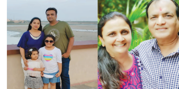
૮૦ ટકા ફેફસાં કોરોનાગ્રસ્ત થઈ