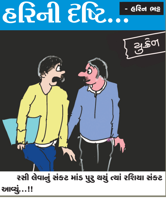
રસી લેવાનું સંકટ માંડ પુરુ થયું ત્યાં રશિયા સંકટ આવ્યું...!!