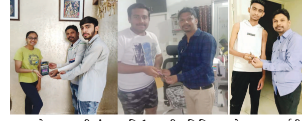
સેક્ટર-૨-સીમાં ગણપતિ ઉત્સવની સમિતિ દ્વારા છેલ્લા ૧૭ વર્ષથી સે-૨-સીમાં વિદ્યાર્થીઓને સમિતિ દ્વારા ઘરે ઘરે જઈને પેન, ચોકલેટ આપી શુભેચ્છા આપવામાં આવે છે. આ વર્ષે પણ જે વિદ્યાર્થીઓ પરીક્ષા આપી રહ્યા છે તેઓને ઘરે ઘરે ફરીને પેન વિતરણ કરવામાં આવી હતી.