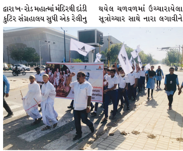
દાંડી યાત્રાના અંતર્ગત ગાંધીનગરમાં મહાત્મા મંદિર પાસેની દાંડી કુટિર સંગ્રહાલય સુધી એક રેલીનું આયોજન કરવામાં આવેલ હતું આ રેલીમાં બાળકો દ્વારા ગાંધી બાપુની વેશભૂષા તેમજ ગાંધીયુગ દરમ્યાન સંગ્રહાલય ખાતે આગમન કર્યું હતું જ્યાં વિદ્યાર્થીઓનું સ્વાગત દાંડી કુટિર સંગ્રહાલયના આસિસ્ટન્ટ

ગાંધીનગર, તા. ૧૨ ગાંધીનગરમાં મહાત્મા મંદિર પાસેની દાંડી કુટિર ખાતે પુરાતત્વ અને સંગ્રહાલય ખાતુ, રમતગમત અને યુવા સાંસ્કૃતિક પ્રવૃત્તિઓના વિભાગ દ્વારા આઝાદી કા અમૃત મહોત્સવ અંતર્ગત 'દાંડી યાત્રા'ના ૯૨ વર્ષની ઉજવણીના ભાગરૂપે બાળકોની રેલીનું આયોજન કરવામાં આવ્યું હતું જેમાં ગાંધીનગરના સે. ૨૩ની શેઠ સી.એમ. હાઈસ્કૂલના વિદ્યાર્થીઓ તેમજ શિક્ષકો ઉત્સાહભરે આ કાર્યક્રમમાં જોડાયા હતા.