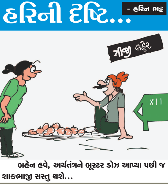
અહેન હવે, અર્થતંત્રને ભૂસ્તર ડોગ આયા પછી જ શાકભાજી સસ્તુ થશે...