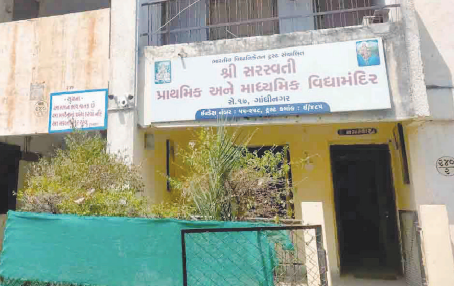
તથા જવાબદાર તંત્ર શેની રાહ જોવે છે તે વિચારવાની

ઉપરના બંને માળ ખાલી છે જેની સાબિતી બતાવે છે કે