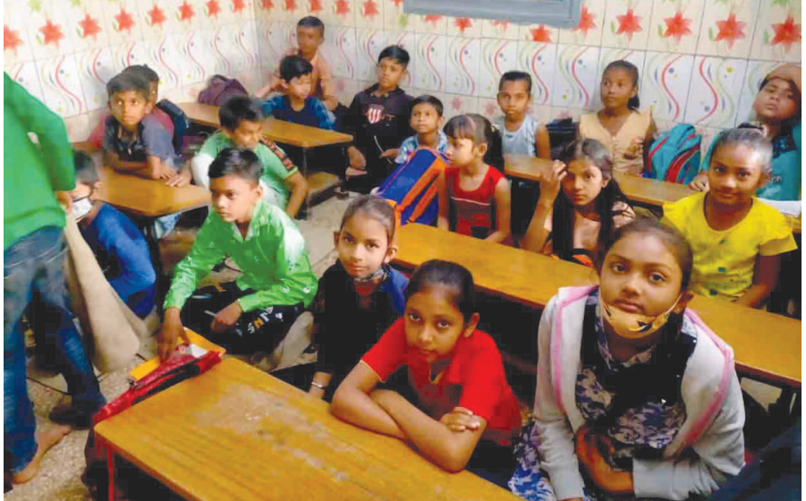
કચેરીઓના પડછાયામાં ભયજનક મકાનોમાં નાના બાળકોનું શિક્ષણ કાર્ય ચાલી રહ્યું છે. એક તરફ તંત્ર દ્વારા મોટું બોર્ડ લગાવવામાં આવ્યું છે કે “આ મકાન ભયજનક છે આ મકાનમાં પ્રવેશ કરવો નહીં આ મકાનથી દૂર રહેવું હુકમથી” ત્યારે આંખ આડા કાન રાખી વર્ષોથી અહીંયા બાળકોના જીવના જોખમે આ મકાનમાં શાળા ધમધમી રહી છે. ૧૯૯૬ થી આ શાળા અહીંયા કાર્યરત છે. જે તે સમયે મકાનની હાલત સારી હતી પરંતુ ગાંધીનગરમાં મોટાભાગના સરકારી ક્વાર્ટર્સ જર્જરિત હાલતમાં થઈ ગયેલા હોવાથી માર્ગ અને મકાન વિભાગ દ્વારા

ગાંધીનગર, તા. ૧૫ શહેરમાં સરકારી નોટિસો લગાવવામાં આવી હતી કે આવા મકાનોમાં જર્જરિત મકાનોમાં રહેવાસીઓ પણ છે અને