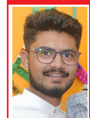
સ્મિત નરેન્દ્ર ભાઈ ચોધરી અર્બુદા કેકોરેશન આક્રમ્મ તાલુકો ધનસુરા