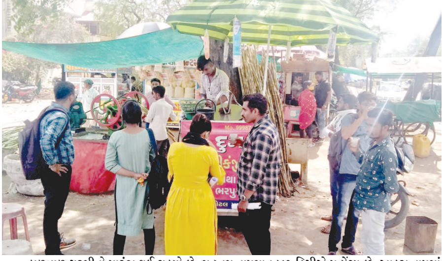
કાળજાળ ગરમીનો પ્રારંભ થઈ ચૂક્યો છે. મહત્તમ તાપમાન ૪૧ ડિગ્રીએ પહોંચ્યું છે. આકરા તાપમાં ઘરની બહાર નીકળવું મુશ્કેલ બની ચૂક્યું છે. કોઈ કામ અર્થે જો ઘરની બહાર નીકળવું પડે તો મુશ્કેલી અનુભવાય એટલું બધી ગરમી પડી રહી છે. ગરમીથી રાહત મેળવવા લીબુ સીકંડ અને લીબુ શરબતનો ઉપયોગ મહત્તમ થાય છે. ગોણસેવા મંડળ દ્વારા યોજાયેલી પરીક્ષા આપવા આવેલા પરીક્ષાર્થીઓએ લીબુ શરબત પીને ગરમીમાં રાહત મેળવી હતી.