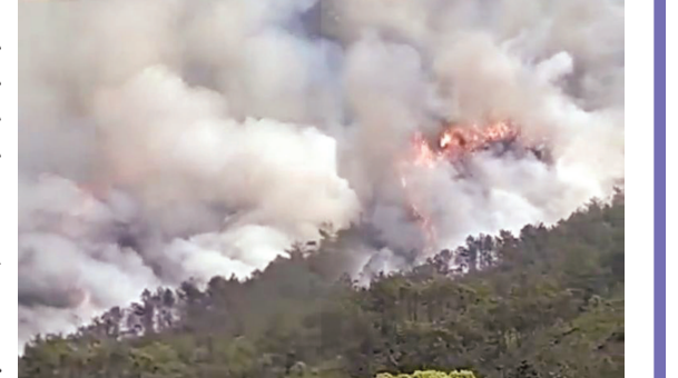
સ્થાનિક મીડિયા રિપોર્ટ્સ મુજબ ચાઈના ઈસ્ટર્ન ફ્લાઈટ એમયુ૫૭૩૫ નિર્ધારિત સમય પર ગંતવ્ય સ્થાન પર નહોત્યા બાદ તપાસ શરુ કરવામાં આવી છે.

બેજિંગ, તા. ૨૧ ચાઈના ઈસ્ટર્ન એરલાઈન્સ ૧૩૨ લોકોને લઈને ચીનનું ૧૩૨ લોકોને જઈ રહેલું ચાઈના ઈસ્ટર્ન એરલાઈન્સ જેટ ક્રેશ થયું છે. આ વિમાન દક્ષિણ-પૂર્વ ચીનમાં ક્રેશ થયું છે. જોકે, આ ઘટનામાં કેટલા લોકોના મોત થયા છે તે અંગેનો આંકડો હજુ સુધી સામે આવ્યો નથી. બોઈંગ ૭૩૭ પ્લેન વુઝોઉ શહેર પાસે આવેલા ગ્રામ્ય વિસ્તાર ગુઆંગ્શીમાં તૂટી પડ્યું છે. રિપોર્ટસમાં કહેવામાં આવી રહ્યું છે કે, ચીનનું વિમાન બોઈંગ વિમાન ક્રેશ થયા બાદ પર્વત વિસ્તારમાં આગની જ્વાળાઓ અને ધૂમાડો જોવા મળ્યો હતો. રિપોર્ટમાં કહેવાઈ રહ્યું છે કે રેસ્ક્યુ ટીમ ઘટના સ્થળ પર જવા માટે રવાના થઈ ગઈ છે.