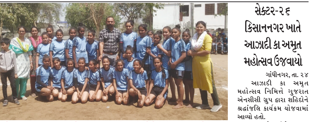
શિલોડા હાઈસ્કૂલ-અન્ડર-૧૪ અને અન્ડર-૧૭ કબડ્ડી સ્પર્ધા બહેનોની ટીમ અવ્વલ અગ્રેસર