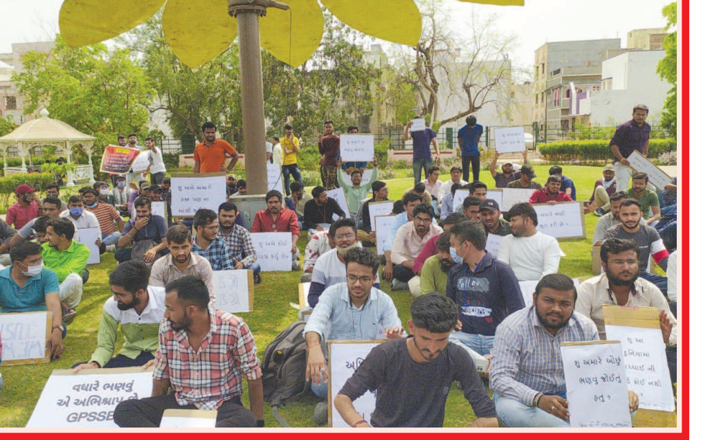
વધારે ભરતું એ અભિલાષીઓ GPSSSE

ગાંધીનગરના સેક્ટર-૮ ખાતેના બગીચામાં આજે સિવિલ ઈજનેરીના સ્નાતક વિદ્યાર્થીઓએ એકઠાં થઈને દેખાવો યોજ્યાં હતા. સિવિલ ઈજનેરી વિદ્યાર્થીઓએ પંચાયત વોર્ડ દ્વારા અધિક મદદનીશ ઈજનેર-સિવિલની ભરતી પ્રક્રિયા હાથ ધરી છે તેમાં થયેલા અન્યાય સંદર્ભે આ દેખાવો કર્યા હતા. આ વિરોધ પ્રદર્શનમાં રાજ્યભરમાંથી મોટી સંખ્યામાં બીઈ સિવિલ ડિગ્રી ધારકો ઉમટી પડ્યા હતા. આજે ગાંધીનગરના સે. ૮ ખાતેના બગીચામાં રાજ્યભરમાંથી સિવિલ ઈજનેરી શાખાના સ્નાતક ડિગ્રી ધારકો ઉમટી પડ્યા હતા. જેઓએ પંચાયત વોર્ડ દ્વારા જાહેરાત ક્રમાંક ૧૩/૨૦૨૧-૨૨ ના અન્વયે અધિક મદદનીશ ઈજનેર (સિવિલ)ની ભરતી પ્રક્રિયામાં બેચલર ઓફ સિવિલ એન્જિનીયરીંગના ડિગ્રી ધારકોને તક ના મળવાથી થયેલા અન્યાય અંગે વિરોધ પ્રદર્શન હાથ ધર્યું હતું. આ ઉમેદવારોના જણાવ્યા અનુસાર ઉક્ત જાહેરાતમાં ડિપ્લોમાં ઈન સિવિલ એન્જિનીયરિંગ અને ડિપ્લોમા ટુ ડિગ્રી ધરાવતા ઉમેદવારોને જ તક આપવામાં આવી છે પરંતુ બીઈ સિવિલની ડિગ્રી ધરાવતા ઉમેદવારોને બાકાત રખાયો છે. ડિગ્રી ધારકોની માંગ છે કે તેમને પણ આ પરીક્ષા આપવા માટેની સમાન તક પુરી પાડવામાં આવે.