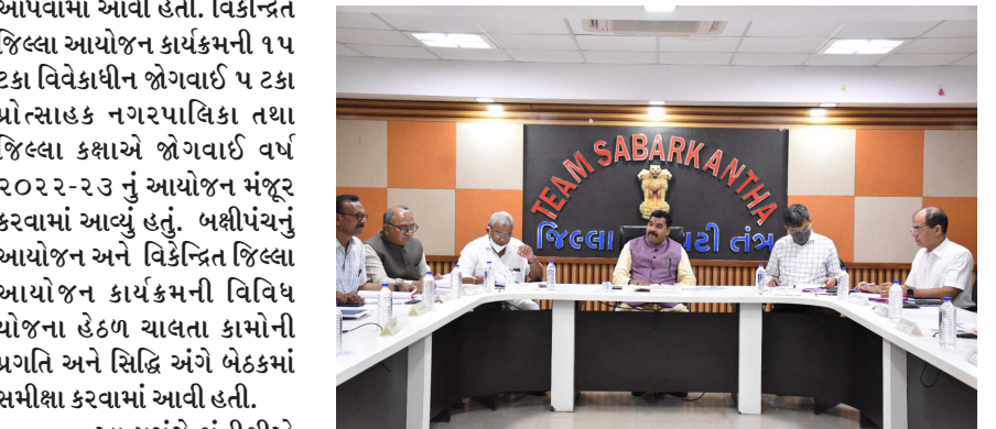
જણાવ્યું હતું કે વિકાસ એ સતત ચાલતી પ્રક્રિયા છે પરંતુ નાણાકીય વર્ષના બાકી રહેલા કામો સત્વરે ઝડપથી પૂર્ણ કરીને જિલ્લા કલેક્ટરશ્રીને રિપોર્ટ કરવા અમલીકરણ અધિકારીઓને સૂચના આપી હતી અને સ્થળ ફેરફાર તેમજ કામો બદલવા અને થાય તો જરૂરી સુધારા-વધારા કરીને પદાધિકારીઓને ધ્યાને મૂકીને સત્વરે કામ કરવા જણાવ્યું હતું અને રાજ્ય સરકારની ગાઈડલાઈન મુજબનો ખર્ચ અને ગુણવત્તાસભર કામ કરવા ઉપર ભાર મુક્યો હતો. એકના એક કામો બેવડાય નહીં તે જોવા તકેદારી રાખવા જણાવ્યું હતું અને કામ પૂર્ણ થયે જીઓ ટેગીંગ કરીને ફોટોગ્રાફ પાડી પૂર્ણ કામો જાહેર નું આયોજન મંજૂર કરવામાં આવ્યું. તથા માન. પ્રભારીમંત્રીશ્રી ધ્વારા ગત વર્ષના પ્રગતિ હેટળના કામો સમયમર્યાદામાં પૂર્ણ કરવા માટે સમીક્ષા કરી. આ બેઠકમાં જિલ્લા પંચાયતના પ્રમુખશ્રી ધીરજભાઈ પટેલ, હિંમતનગરના ધારાસભ્ય

બાયડ તા.૨૬ સાબરકાંઠા જિલ્લા કલેક્ટર કચેરી ખાતે જિલ્લા પ્રભારીમંત્રીશ્રી ડો. કુબેરભાઈ ડીડોરની અધ્યક્ષતામાં જિલ્લા આયોજન મંડળની બેઠક મળી હતી. જેમાં ગત બેઠકમાં કરેલી કાર્યવાહી નોંધને બહાલી આપવામાં આવી હતી. વિકેન્દ્રિત જિલ્લા આયોજન કાર્યક્રમની ૧૫ ટકા વિકાસીય જોગવાઈ ૫ ટકા પ્રોત્સાહક નગરપાલિકા તથા જિલ્લા કક્ષાએ જોગવાઈ વર્ષ ૨૦૨૨-૨૩ નું આયોજન મંજૂર કરવામાં આવ્યું હતું. બક્ષીપંચનું આયોજન અને વિકેન્દ્રિત જિલ્લા આયોજન કાર્યક્રમની વિવિધ યોજના હેઠળ ચાલતા કામોની પ્રગતિ અને સિદ્ધિ અંગે બેઠકમાં સમીક્ષા કરવામાં આવી હતી. આ પ્રસંગે મંત્રીશ્રીએ જણાવ્યું હતું કે વિકાસ એ સતત ચાલતી પ્રક્રિયા છે પરંતુ નાણાકીય વર્ષના બાકી રહેલા કામો સત્વરે ઝડપથી પૂર્ણ કરીને જિલ્લા કલેક્ટરશ્રીને રિપોર્ટ કરવા અમલીકરણ અધિકારીઓને સૂચના આપી હતી અને સ્થળ ફેરફાર તેમજ કામો બદલવા અને થાય તો જરૂરી સુધારા-વધારા કરીને પદાધિકારીઓને ધ્યાને મૂકીને સત્વરે કામ કરવા જણાવ્યું હતું અને રાજ્ય સરકારની ગાઈડલાઈન મુજબનો ખર્ચ અને ગુણવત્તાસભર કામ કરવા ઉપર ભાર મુક્યો હતો. એકના એક કામો બેવડાય નહીં તે જોવા તકેદારી રાખવા જણાવ્યું હતું અને કામ પૂર્ણ થયે જીઓ ટેગીંગ કરીને ફોટોગ્રાફ પાડી પૂર્ણ કામો જાહેર નું આયોજન મંજૂર કરવામાં આવ્યું. તથા માન. પ્રભારીમંત્રીશ્રી ધ્વારા ગત વર્ષના પ્રગતિ હેટળના કામો સમયમર્યાદામાં પૂર્ણ કરવા માટે સમીક્ષા કરી. આ બેઠકમાં જિલ્લા પંચાયતના પ્રમુખશ્રી ધીરજભાઈ પટેલ, હિંમતનગરના ધારાસભ્ય