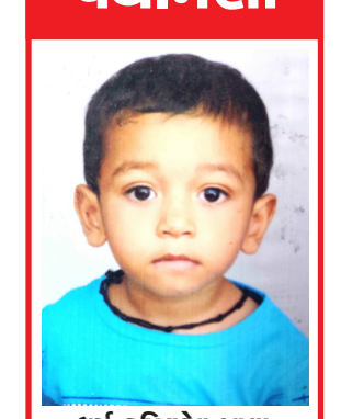
ધર્મ કપિલદેવ ઝાલા વૃંદાવન સોસાયટી બાયડ ગુલ્લો અરવલ્લી