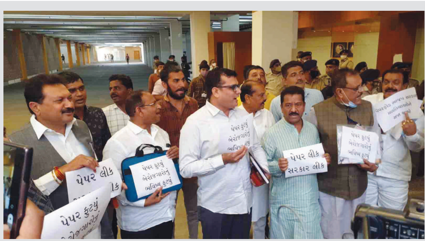
વિધાનસભામાં ફરીવાર કોંગ્રેસે હંગામો મચાવ્યો હતો. ભરતી પરીક્ષાના વારંવાર ફટી જતા પેપરો બાબતે કોંગ્રેસના ધારાસભ્યોએ વિધાનસભાની બહાર સૂત્રોચ્ચાર કર્યા હતા અને દેખાવો કર્યા હતા.