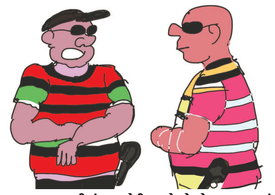
નાનગણ થી હું કામચોરી કરતો એટલે આ લાજનમાં આવ્યો...તુ કેમ આવ્યો...!!