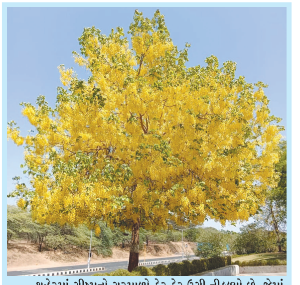
શહેરમાં ગ્રીષ્મનો ગરમાળો ઠેર ઠેર ઉગી નીકળ્યો છે. જેમાં ફોરેન્સિક સાયન્સ યુનિવર્સિટીના ગેટ સામે સુંદર મજાનો ગરમાળો પીળા સોનેરી રંગના પુષ્પોથી શોભાયમાન બન્યો છે.