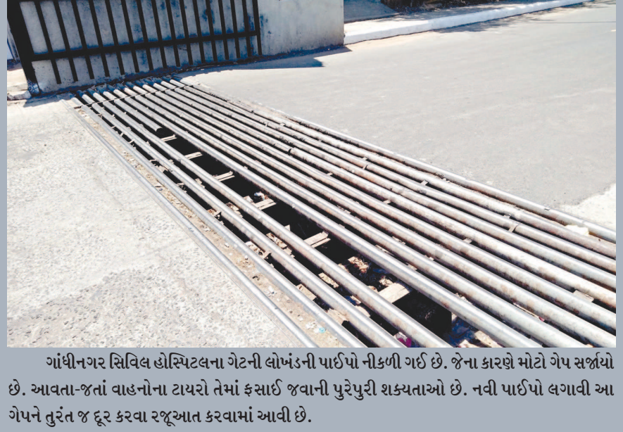
ગાંધીનગર સિવિલ હોસ્પિટલના ગેટની લોખંડની પાઈપો નીકળી ગઈ છે. જેના કારણે મોટો ગેપ સર્જાયો છે. આવતા-જતાં વાહનોના ટાયરો તેમાં ફસાઈ જવાની પુરેપુરી શક્યતાઓ છે. નવી પાઈપો લગાવી આ ગેપને તુરંત જ દૂર કરવા રજૂઆત કરવામાં આવી છે.