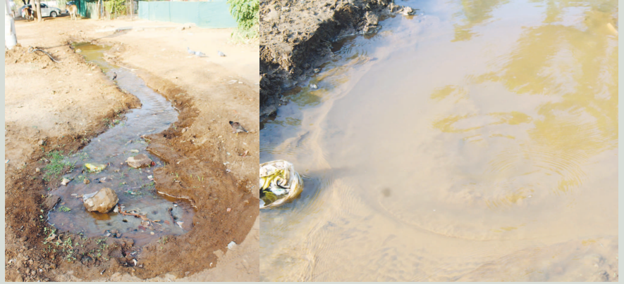
સેક્ટર-૨૨ 'ઇ' ટાઈપ, બ્લોક નં. ૯૬/૩ ની સામે પાણીની નવી પાઈપલાઈન નાંખવામાં આવી છે. આ પાઈપલાઈન છેલ્લા ઘણા સમયથી લિકેજ છે. આ લીકેજના કારણે પાણી સતત વેડફાઈ રહ્યું છે. અહીં દરરોજ હજારો લીટર પાણી વેડફાઈ રહ્યું છે.