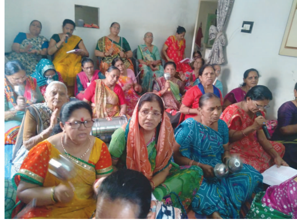
માં મેલડી આનંદ ગરબા મંડળ દ્વારા મોટી સંખ્યામાં ભાવિ ભક્તો ની ઉપસ્થિતિમાં આનંદનો ગરબો યોજાયો હતો. જેમાં મોટી સંખ્યામાં ભાવિ ભક્તો ઉપસ્થિત રહ્યા હતા.