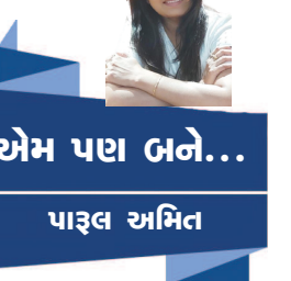
એમ પણ બને... પાડલ અમિત

ગમે તે ઉમરના થઈએ મા માટે તો બાળક જ રહીએ છીએ. મા માટે કોઈ એક દિવસ ના હોય.. એનું ઋણ ઉતારવા તો સાત જન્મો પણ ઓછા પડે. પરંતુ જો કોઈ એક દિવસ મળે બધી લાગણીઓ કહેવા માટે તો ખોટું શું છે. મા દિવસ રોજે રોજ હોય છે. પણ આજનો દિવસ મા ને સમર્પિત. દુનિયામાં આજે જો કોઈનો પ્રેમ નિઃસ્વાર્થ રહ્યો હોય તો એ છે માતાનો પ્રેમ. મા ગમે તે પરિસ્થિતિમાં પણ એક માઈ જ રહે છે. બાળકો જ્યાં સુધી મમ્મીના ખોળામાં, એના આશરમાં હોય ત્યાં સુધી એ નીડર હોય છે. કેટલી શક્તિ, કેટલી હિંમત અને કેટલી શાંતિ માત્ર મા ના સાથે હોવાથી મળે છે. એમનામ નથી કહેવાતું કે 'મા તે મા બીજા બધા વગડાના વા' ઈશ્વર પ્રેમનું સર્જન કર્યું હશે ત્યારે સૌથી પ્રથમ માતા બનાવવાનું વિચાર્યું હશે.. દુનિયાની દરેક મા ઈશ્વર નો પર્યાય છે. માણસ હોય કે પશુ પક્ષી કે જીવ જતું.. બધા મા મા થકી જ પૃથ્વી પર અવતરણ પામ્યા છે. ખુદ ઈશ્વરને પણ જન્મ લેવા માની કુખે અવતરવું પડ્યું. મા એટલે વાસ્તવ્યની મૂર્તિ. એના જેવી વ્યક્તિ આ જગતમાં મળે એમ નથી. મા વિશે માત્ર મા લખીએ એમાં બધું જ આવી જાય, જો લખવા બેસીએ તો શબ્દો પૂટી પડે એટલે માત્ર મા શબ્દ બધું કહી જાય છે.