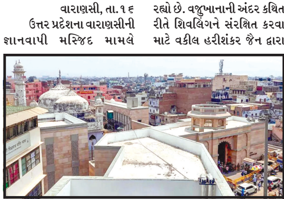
સોમવારે એક નવો વર્ણક આવ્યો છે. મસ્જિદની અંદરથી શિવલિંગ મળ્યું હોવાનો દાવો કરવામાં આવી